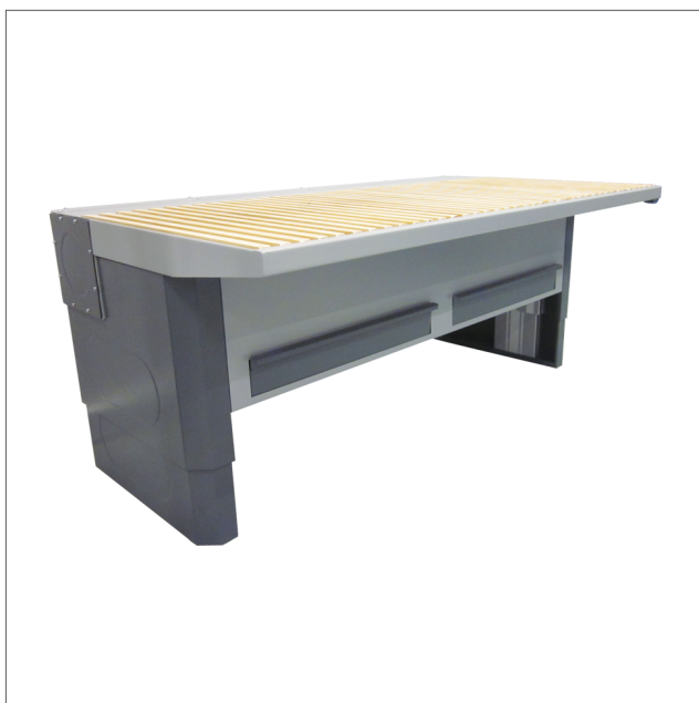
Bordplatta med utsug