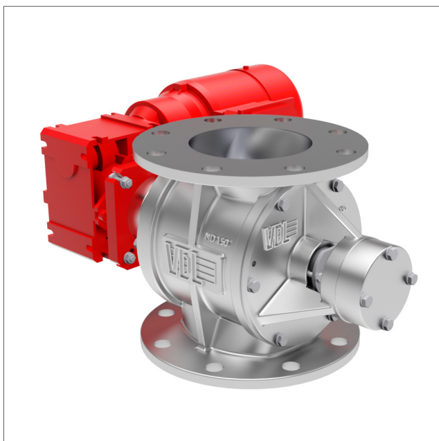
MD - rotorsluss för höga undertryck, <100000 pa

Rotorsluss MD, för pneumatiska transportsystem, försedd med 8-bladig rotor. Lackerad i RAL 9007 som standard men går att få i andra färger. Finns även i ATEX-godkänt utförande. Lämplig för pneumatisk transport av pulver och granulat med höga differentialtrycksnivåer >100000 Pa. MD-serien är utrustad med ett stort inlopp för en optimal fyllningsprocess.