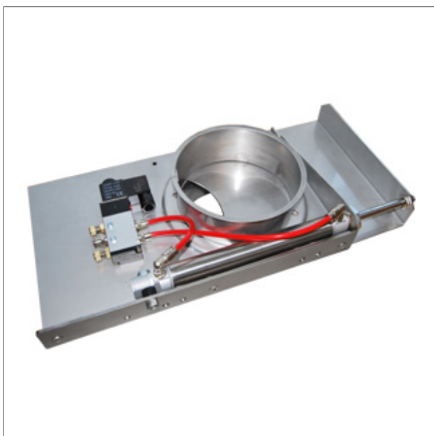
AUDS - Skjutspjäll tryckluftsdrevet AISI 304

Försäkran om överensstämmelse enligt EU-direktiv 2006/42/EG. Var medveten om att enheten inte kan tas i bruk förrän maskinen eller systemet där spjället skall ingå, uppfyller kraven i EU:s maskindirektiv.