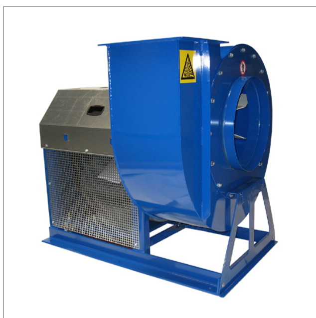
JK-K - Fläkt remdriven

De indirekta centrifugala fläkten JK-K är konstruerad för materialhantering. Utrustad med självrengöringshjul med bakåtlutande skovlar och aerodynamiska intag. Fläkthjulen är statiskt och dynamiskt balanserade. Remskivorna är axelmonterade med taperlockbussning, vilket underlättar vid byte av fläkthastighet. Max. driftstemperatur: 60°C. Med kylvingar: Upp till 200°C. Antal blad reduceras med 2 för pappershjul. Finns i anti-gnistversion med rostfritt stål och explosionsbeständig (Eex) motor