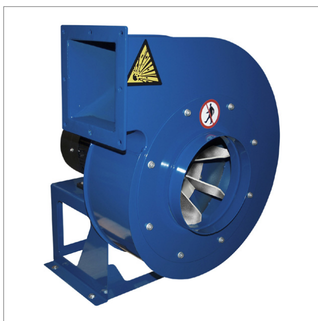
JK-D - Fläkt direktdriven

Fläkttyperna JK-D är konstruerade för materialhantering. Utrustad med självrengöringshjul med bakåtlutande och aerodynamiska intag. Fläkthjulen är statiskt och dynamiskt balanserade. Max. driftstemperatur: 60°C. Antal blad minskar med 2 för pappershjul. Finns i anti-gnistversion med rostfritt stål och explosionsbeständig (Eex) motor.