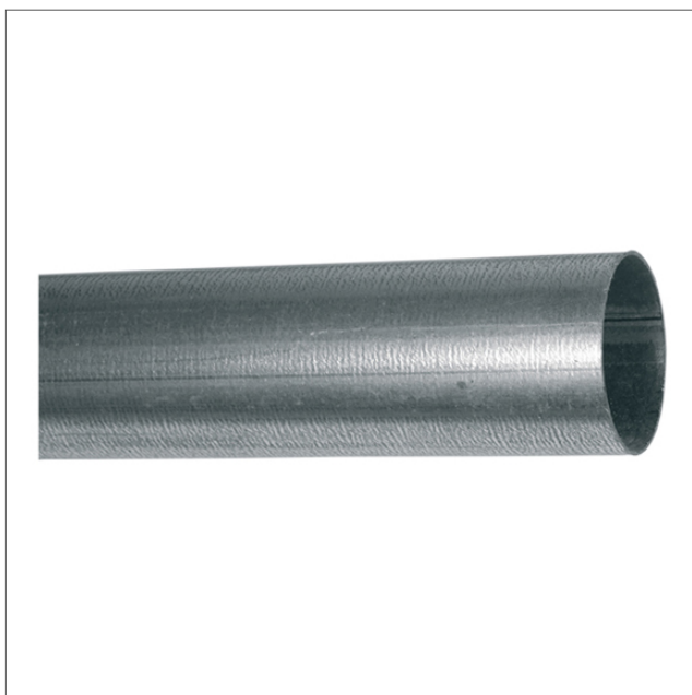
STPI - Rör senzimirförzinkat

Stålrör STPI, senzimirförzinkat. Rören finns i andra godstjocklekar och ytbehandlingar - begär offert. Rör STPI är tillverkat i svetsat senzimirförzinkad plåt. Finns i längderna 3000 och 6000 mm. Längd 3000 mm = +/- 2 mm Längd 6000 mm = +/- 5 mm